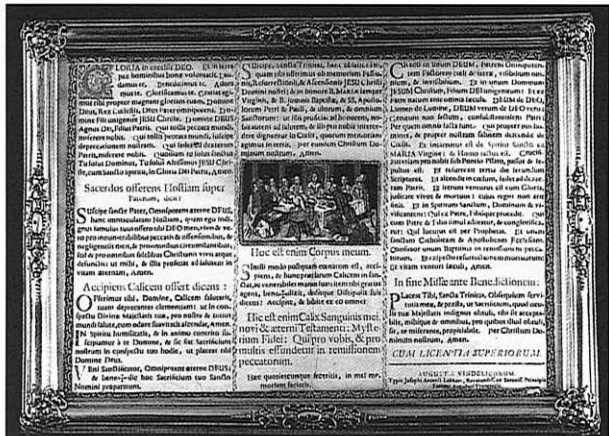
L'un des trois cadres des canons d'autel, 1744. La feuille a été imprimée à Augsbourg par Joseph Anton Labhart; la vignette coloriée représente la Cène.