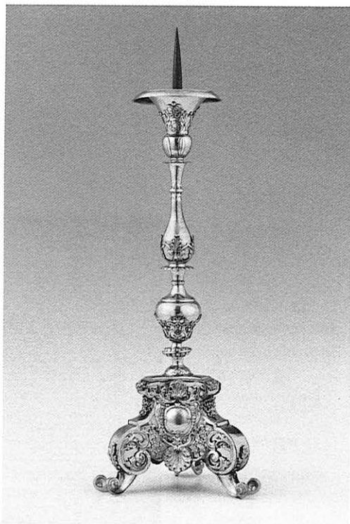
L'un des six chandeliers de 1744.