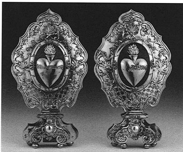
Paire de reliquaires, avec les cœurs du Christ et de la Vierge, 1744.